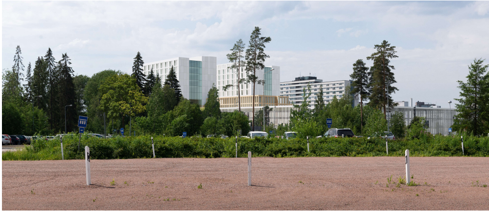
Kuva. Teiskontien sisääntuloväylän TAYS:n aluenäkymä.

Asianajotoimisto Project Law Oy / Asianajaja Matias Forss:n laatimassa; ”Oikeudellinen selvitys poikkeamisluvan myöntämisen edellytyksistä” -lausunnossa todetaan, että; ”Asemakaavaa laadittaessa rakennetun ympäristön tavoitteita on siis suhteutettu palvelujen ja toimintojen toimintamahdollisuuksien turvaamiseen. A- ja B-rakennuksien säilyttämistä on tarkasteltu nimenomaan osana uudistuvaa kokonaisuutta. Näin ymmärrettynä rakennetun ympäristön suojelun tavoitteet käsittävät TAYSin alueen historiallisen rakennuskannan säilyttämisen osana jatkuvasti kehittyvää sairaala-aluetta. Esitetty suunnitelma ei vaaranna tätä tavoitetta. B-rakennus säilyttää tunnistettavan muotonsa ja asemansa kaupunkikuvassa. ”